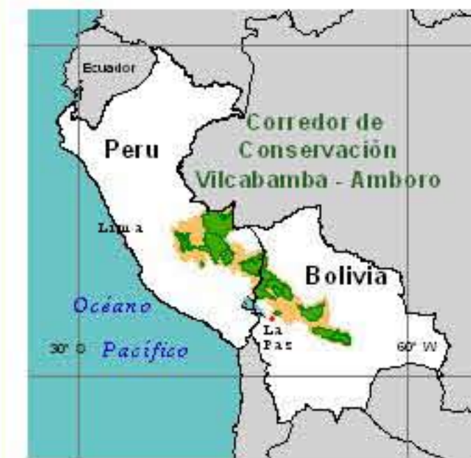
Localización del Corredor de Conservación Vilcabamba - Amoro

Proyección: Geográfica